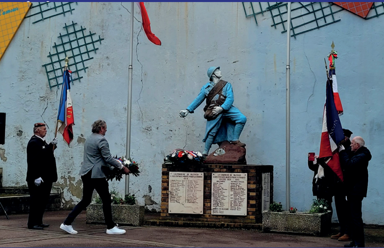
Commémoration du 28 avril 2024

+ de photos sur les réseaux sociaux, suivez-nous!