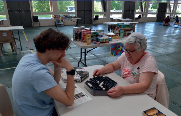
Blénod joue en famille