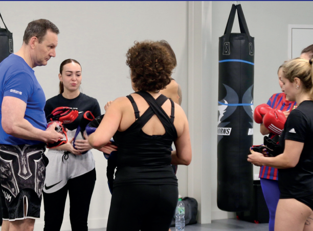
Cours MMA / self défense