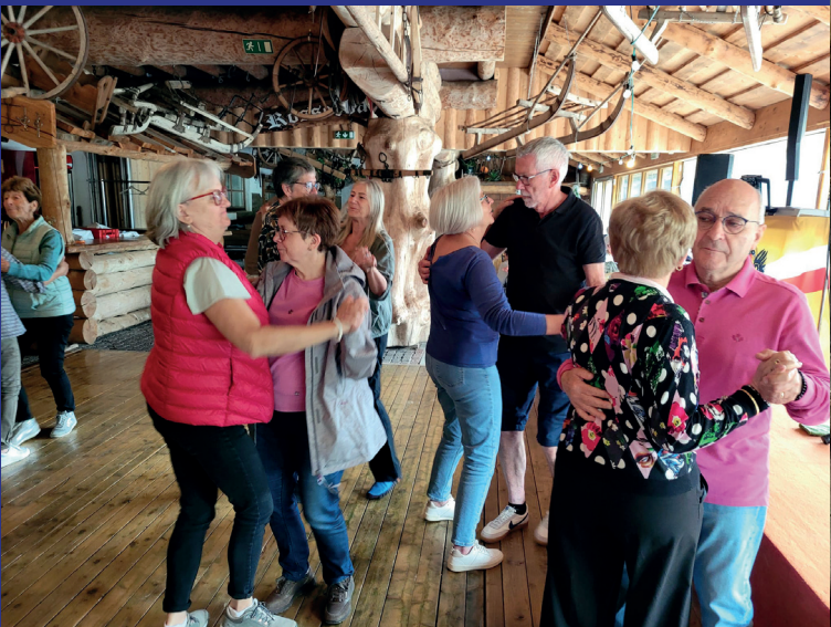
Voyage au Tyrol