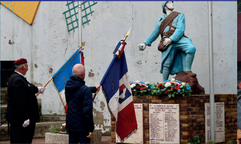
Commémoration du 8 mai 2024