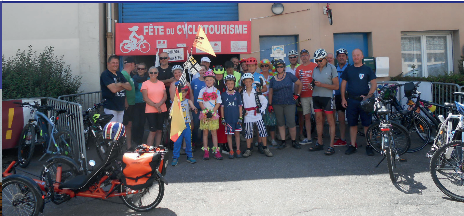
Fête du vélo